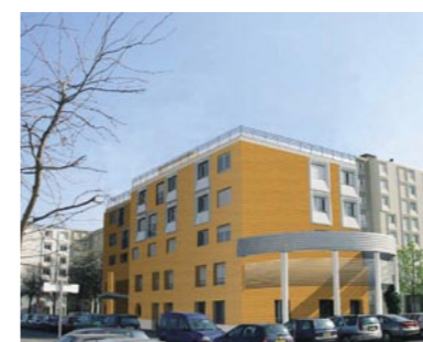
Vue 3D du projet de pension de famille Maison Rossini à Valence. (archi.Chambaud - Burgard) Livraison des travaux : octobre 2010 (24 logements).