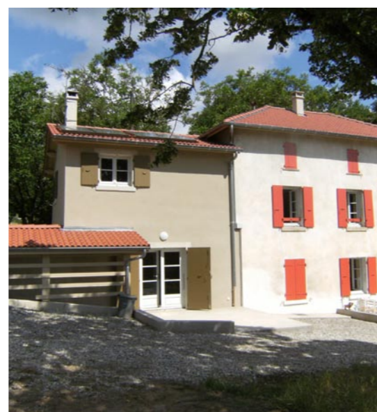
Réalisation de deux logements d'insertion.

La maîtrise d'ouvrage du CALD est un outil au service de cet objectif. La totalité des locataires du CALD est orientée par le travail social (CLH, Villes, CCAS...) et entre bien sûr dans les critères du logement d'insertion qui concernent, rappelons le, entre 30 et 45 % des ménages drômois selon les territoires.