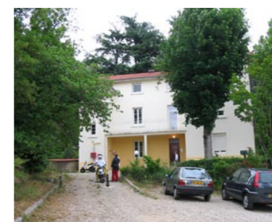
Villa Marie-thérèse Résidence sociale Villa Marie-thérèse à Saint-Vallier (12 logements).