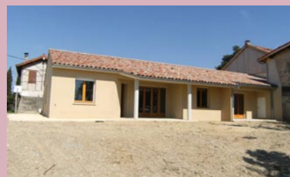
Une habitation en cours de réhabilitation.

C'est le rôle de la mission MOUS Insertion confiée au CALD par l'État et le Département, de faire le lien entre le repérage des ménages par les CLH et les solutions logement à rechercher, à mobiliser, à imaginer avec tous les acteurs.